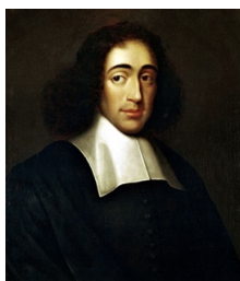
Portrait de Spinoza, anon., 1665, Herzog August Bibliothek.